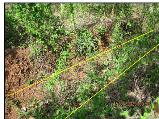
ภาพที่ 2.3 คั่นดินและคูระบายน้ำพื้นที่โครงการ