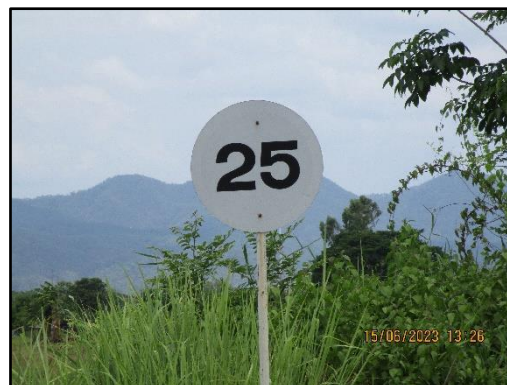
ภาพที่ 2.11 ป้ายจำกัดความเร็วไม่เกิน 25 กิโลเมตร/ชั่วโมง