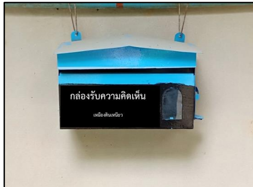
ภาพที่ 2.1 กล่องรับเรื่องราวร้องทุกข์/ความคิดเห็น