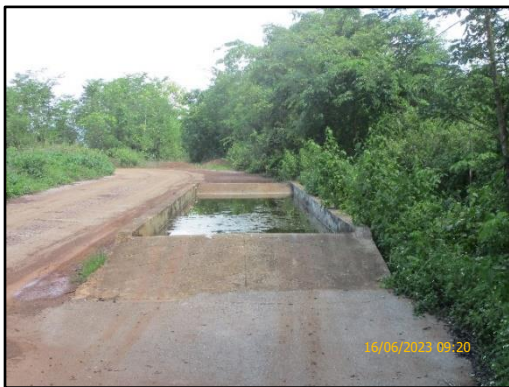
ภาพที่ 2.7 บ่อล้างล้อรถบรรทุกที่ขนส่งแร่