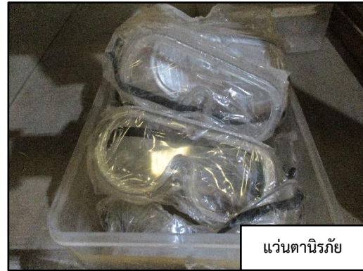
แว่นตานิรภัย