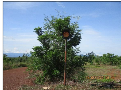
ภาพที่ 2.6 สัญญาณจราจรไฟกระพริบทางเข้า-ออกของพื้นที่โครงการ