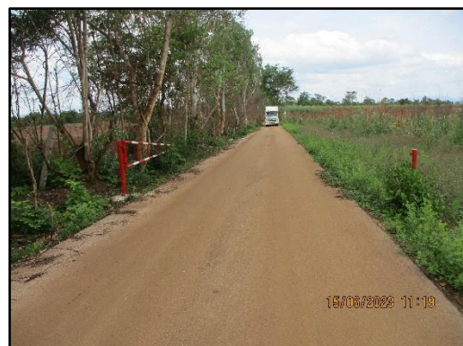
ภาพที่ 2.14 เส้นทางลำเลียงแร่ภายในโครงการ