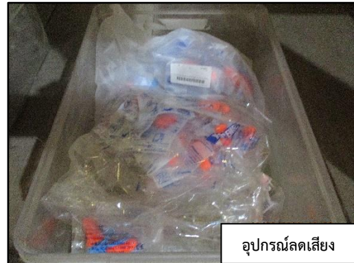
อุปกรณ์ลดเสียง