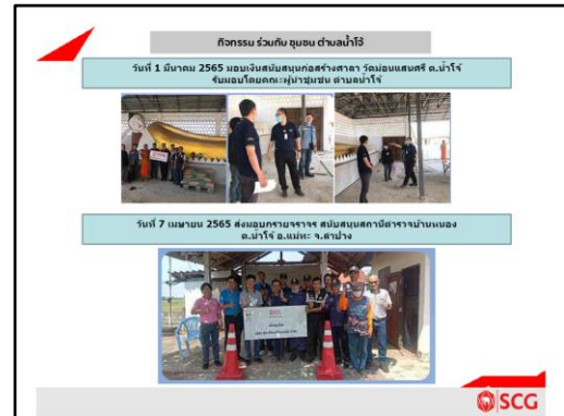
ภาพที่ 2.16 กิจกรรมการมีส่วนร่วมกับชุมชน