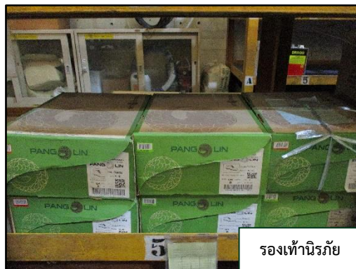
รองเท้านิรภัย