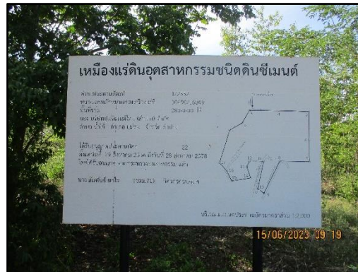
ภาพที่ 2.9 ป้ายประทานบัตร