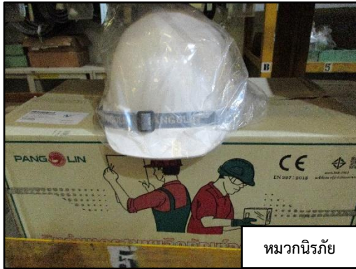
หมวกนิรภัย