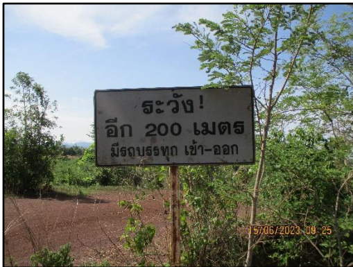
ภาพที่ 2.5 ป้ายสัญญาณจราจรมีรถขนส่งแร่เข้า-ออก ของพื้นที่โครงการ