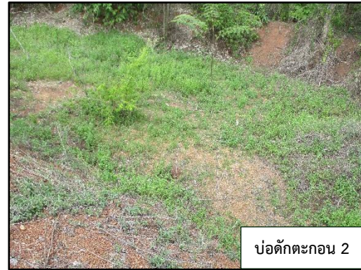
ภาพที่ 2.4 บ่อดักตะกอน 1 และ 2