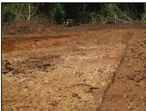
ภาพที่ 2.13 บ่อรับน้ำ Sump บริเวณพื้นที่โครงการ