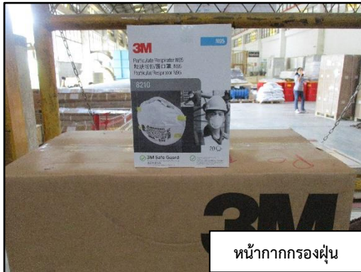
หน้ากากกรองฝุ่น