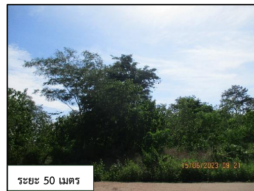
ภาพที่ 2.2 พื้นที่เว้นการทำเหมืองในระยะ 10 เมตร และ 50 เมตร