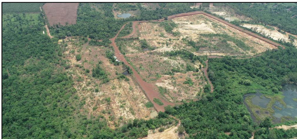
ภาพที่ 2.10 สภาพปัจจุบันของพื้นที่โครงการ